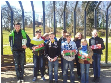
Ciemojoties pie Kandavas draudzes Svētdienas skolas

Priecājos, ka vadot Svētdienas skolu, varu kalpot Dievam, tā pateikties par Viņa žēlastības laiku man un manai ģimenei.