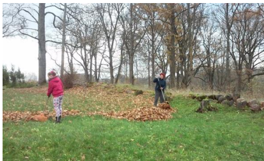
Sakopjam baznīcas apkārtni